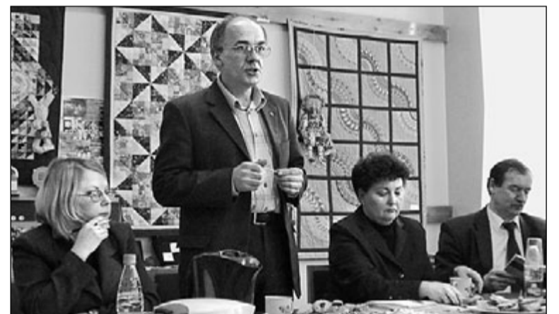
Рабочий семинар в Сеgezhe

В декабре 2006 г. Карельский ресурсный Центр общественных организаций (КРЦОО) приступил к реализации крупного проекта «Развитие Центра поддержки некоммерческих организаций, действующих на территории Республики Карелия и прилегающих территориях субъектов РФ».