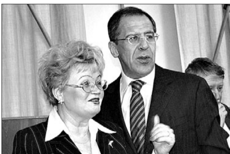
Министр иностранных дел РФ С. В. Лавров и ответственный секретарь НПО Л. П. Жохова на международной конференции в Петрозаводске. Январь 2005 г.

— Это руководители около 30 некоммерческих общественных объединений и организаций, представители бизнеса, а также более 25 экспертов — представители федеральных, республиканских органов власти, региональных научных и образовательных структур.