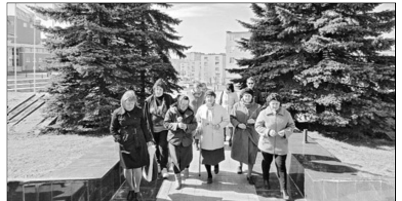
Участники проекта в центре города Кондопоги

Общественная организация женщин Кондопожского района «Современницы» при поддержке Министерства Республики Карелия по вопросам национальной политики, связям с общественными и религиозными объединениями и средствами массовой информации с января 2015 года приступила к реализации проекта «Знакомьтесь, Карелия».