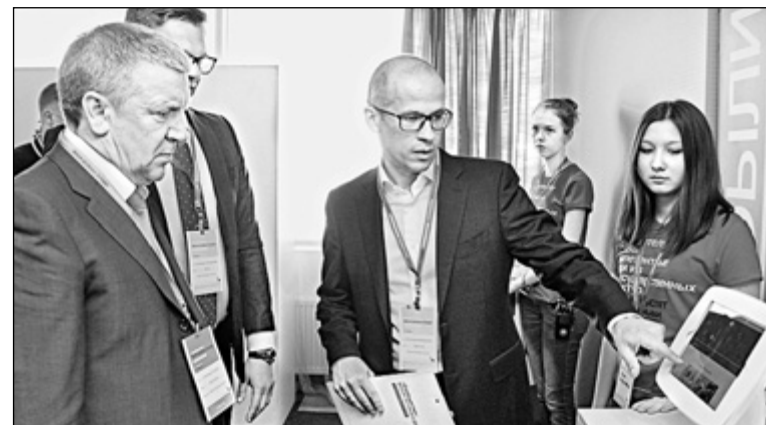
Александр Худилайнен и Александр Бречалов на одной из площадок форума

Фото Андрея РАЕВА (Информация пресс-службы Правительства РК)