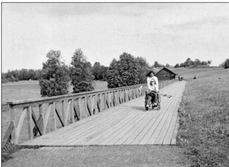
Остров Кижь стал доступнее для инвалидов