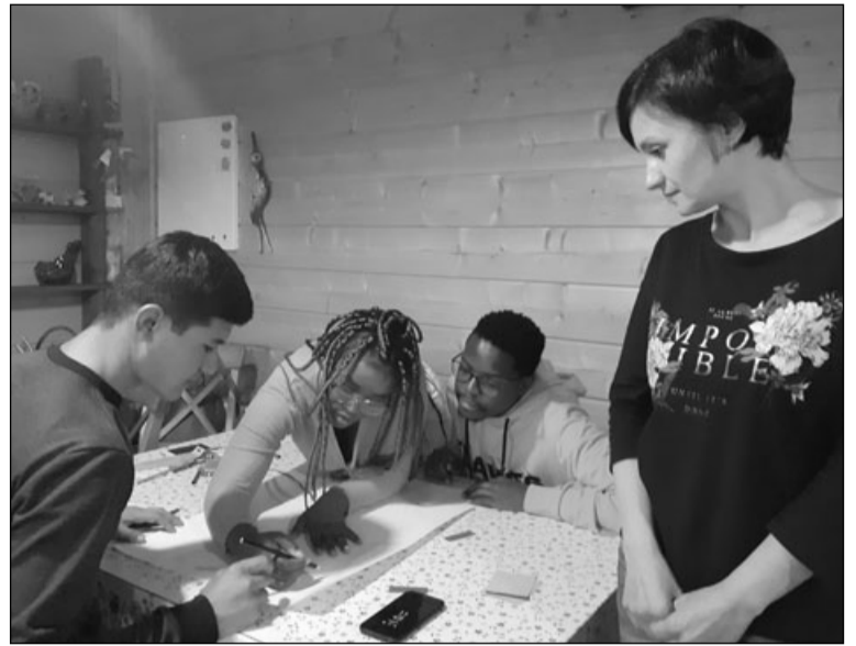
Студенты ПетрГУ — участники игры «Я люблю Карелию»