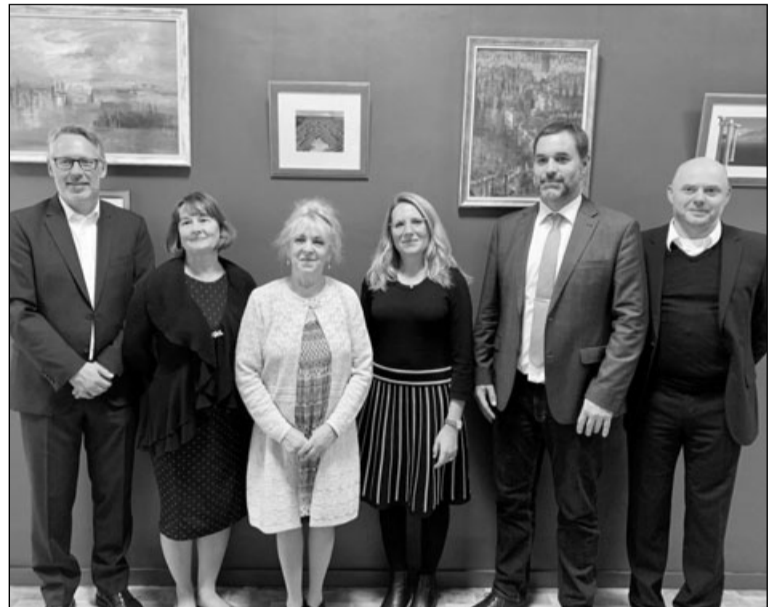
Гости из города-побратима Тюбингена в Державинском лицее

Оба хора — любительские коллективы, которые объединяют представителей разных профессий. На юбилейном вечере хоры