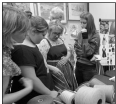
Мастер-класс по ткачеству