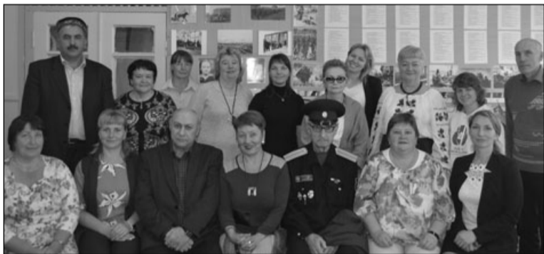
Участники проекта в Толвуйской средней школе

По материалам Министерства национальной и региональной политики Республики Карелия