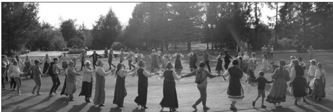
Флешмоб «Карельская крууга»

По материалам Министерства национальной и региональной политики Республики Карелия