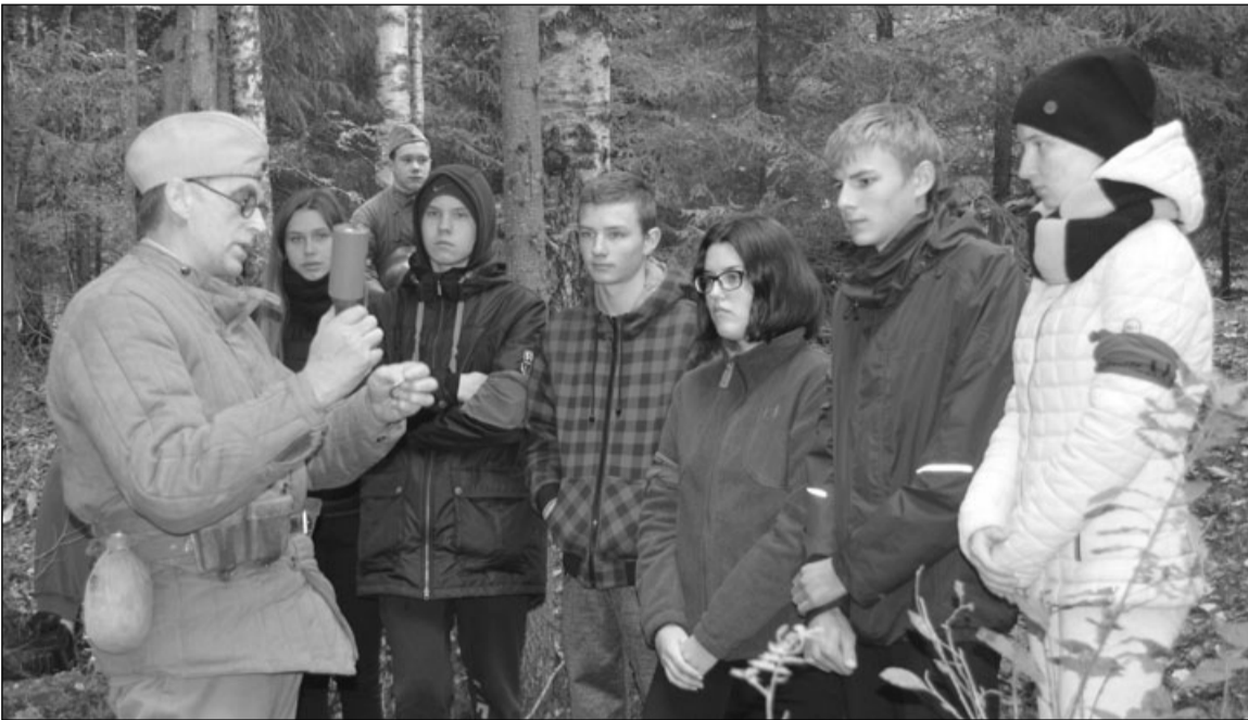
Участники игры-поиска «Как это было?» знакомятся с боевым оружием

Завершается проект «Война — помнить и не повторить»