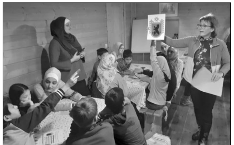
Дети во время игры знакомятся с государственными символами Республики Карелия

По материалам Министерства национальной и региональной политики Республики Карелия и Администрации Петрозаводского городского округа