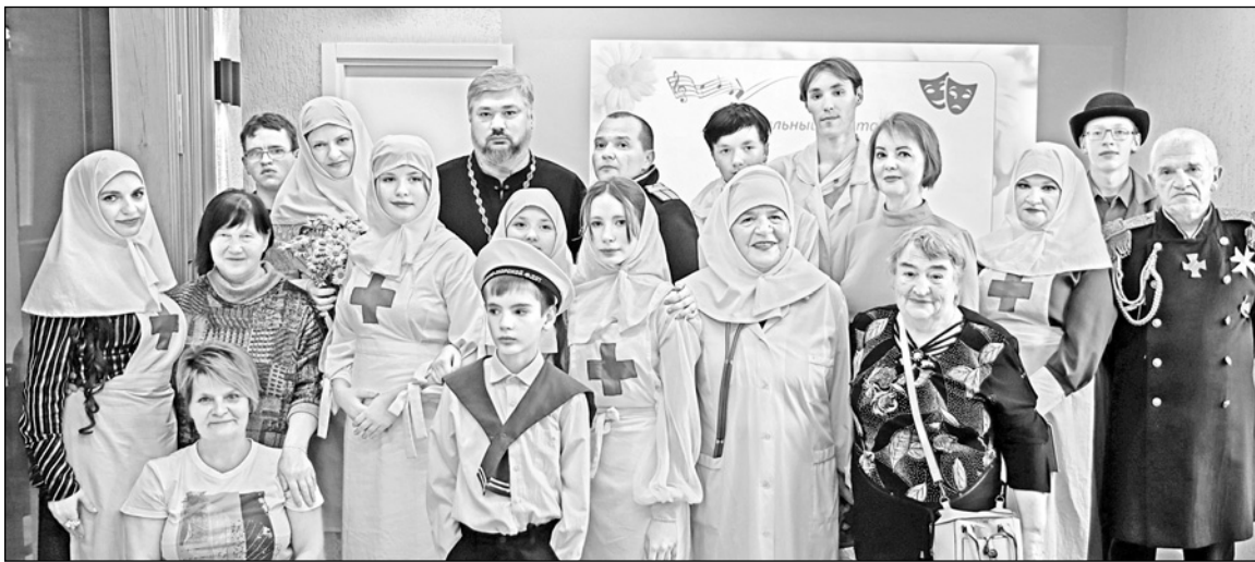
Ученики и воспитатели воскресной школы «София» — участники спектакля