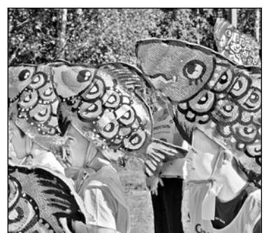
На фестивале ряпушки в Вокнаволоке

Участие карельских представителей во II Всероссийском форуме финно-угорских народов поддержано Министерством национальной и региональной политики Республики Карелия.