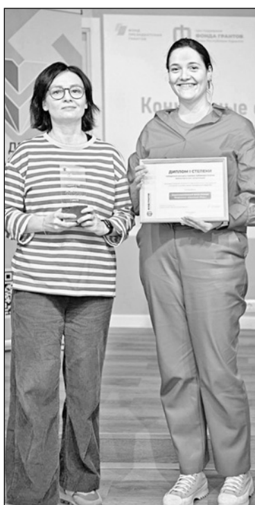
Победитель конкурса годовых публичных отчетов за 2022 год — Благотворительный фонд «Рекс»

Много слов благодарности от общественников прозвучало в адрес специалистов Фонда грантов Главы Республики Карелия за отзывчивость и оказываемую большую поддержку в сопровождении не только реализуемых проектов, но и деятельности организаций.