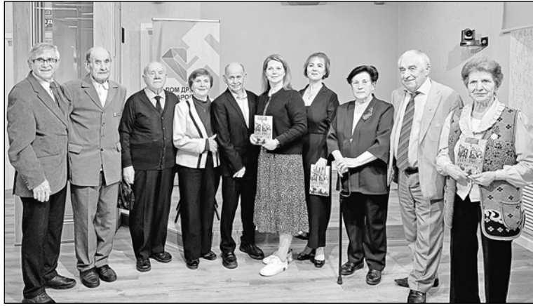
Участники презентации книги «Мы еще живы!»

По данным Управления труда и занятости Карелии, на конец июня 2022 года в Карелию прибыли 322 человека из ДНР, ЛНР и Украины, и эта цифра будет только расти. С каждым днем международная ситуация становится все более напряженной. В таких условиях сотрудники ЦМС