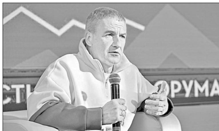
Глава Республики Карелия А. О. Парфенчиков выступает на форуме