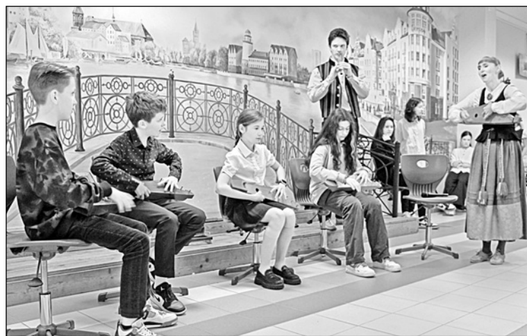
Юные калининградцы (гимназия № 40) знакомятся с карельским кантеле