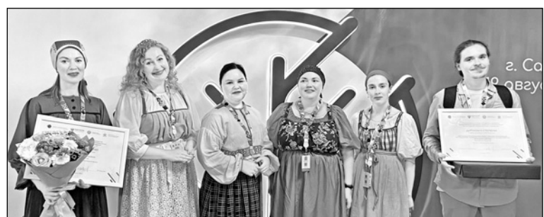
Делегация Карелии на форуме в Саранске