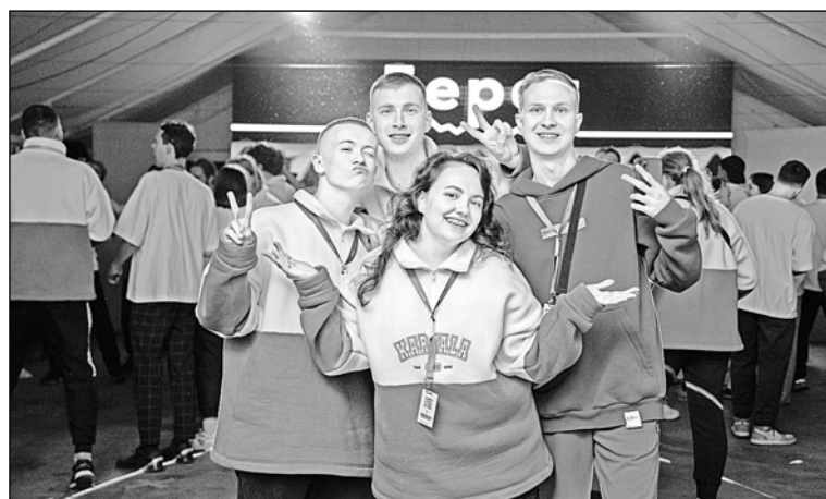
Участники форума «Берег»