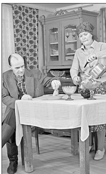
Спектакль Kyl'mil на карельском языке театральной студии «Колесо жизни» Олонецкого музея карелов-ливвиков